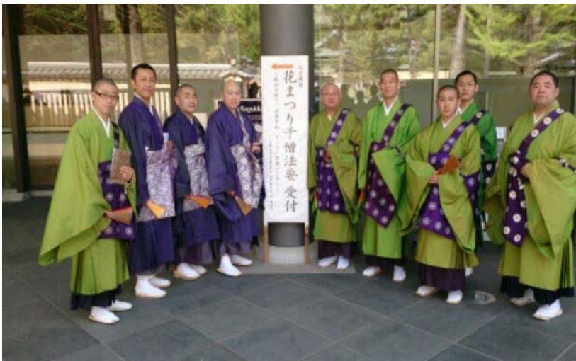
神奈川県天台仏教青年会出仕者

蓮台の上の法要をさせていただくということはとても貴重な経験であり、この千僧法要以外ではその機会を得ることは難しいのです。貴重な仏縁をいただきました。